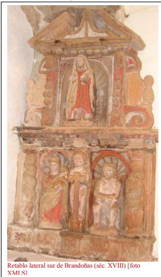
Retablo lateral sur de Brandoñas (séc. XVIII)

O retablo norte parece estar presidido pola figura de Santiago, que aparece vestido de cabaleiro á usanza do XVIII (con casaca e sombreiro de tres puntas); no corpo inferior hai un frade