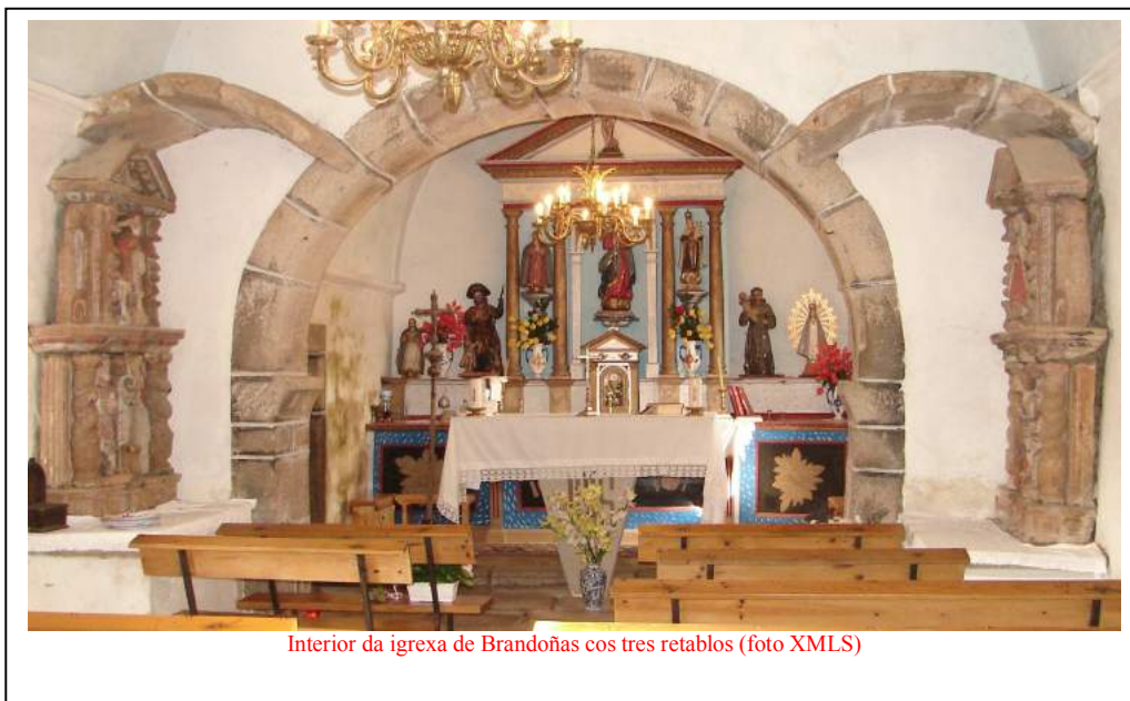
Interior da igrexa de Brandoñas cos tres retablos