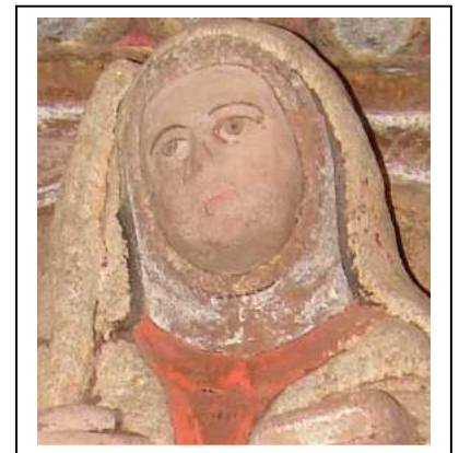
Rostros dalgunhas imaxes dos retablos de pedra da igrexa de Brandoñas (séc. XVIII). Arriba: Santiago, Virxe co neno, Ecce Homo. Abaixo: ancho portador da cruz, frade, mártir descoñecida