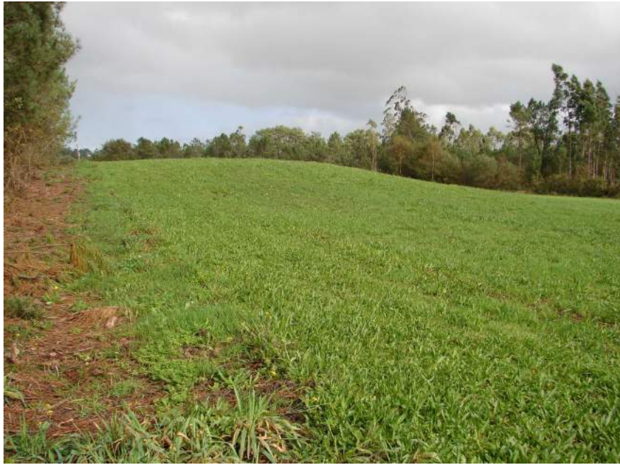
Mámoa dos Currais (Brandoñas)