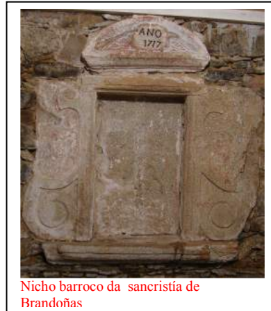
Nicho barroco da sacristía de Brandoñas

Fóra do retablo, na parte esquerda, hai unha traballada imaxe de san Roque de estilo barroco, obra seguramente da segunda metade do séc. XVIII; vai vestido coas roupas de peregrino a Compostela, cun chapeu de amplas abas na cabeza –adornado cunha vieira-e ao seu pé conserva a figura do anxo que lle traía os perfumes contra a peste e o can co pan na boca que o alimentaba, segundo a tradición. Na parte dereita do retablo hai un santo Antonio, tamén de estilo barroco, vestido co seu hábito franciscano; esta figura foi restaurada nos últimos anos e, froito desta restauración, engadíuselle un neno Xesús bastante desproporcionado, que sostén coas dúas mans.