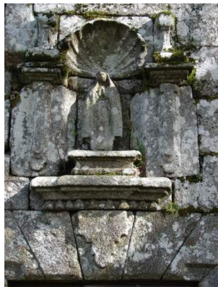
Detalle da fachada, coa placa do arco alintelado e imaxe da Virxe cun dosel avieirado