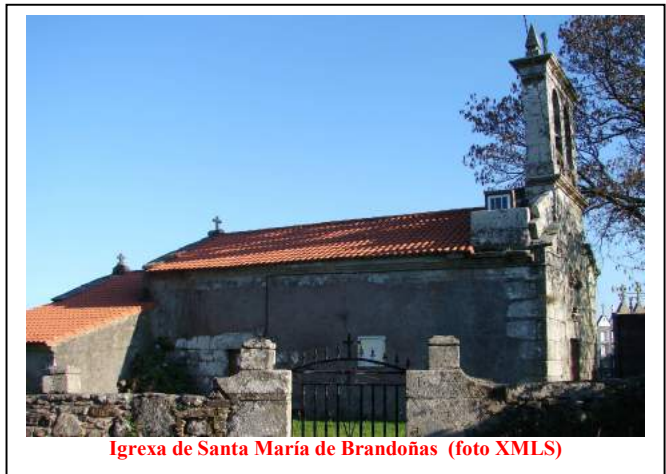
Igrexa de Santa María de Brandoñas