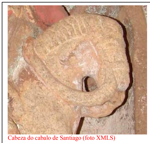
Cabeza do cabalo de Santiago