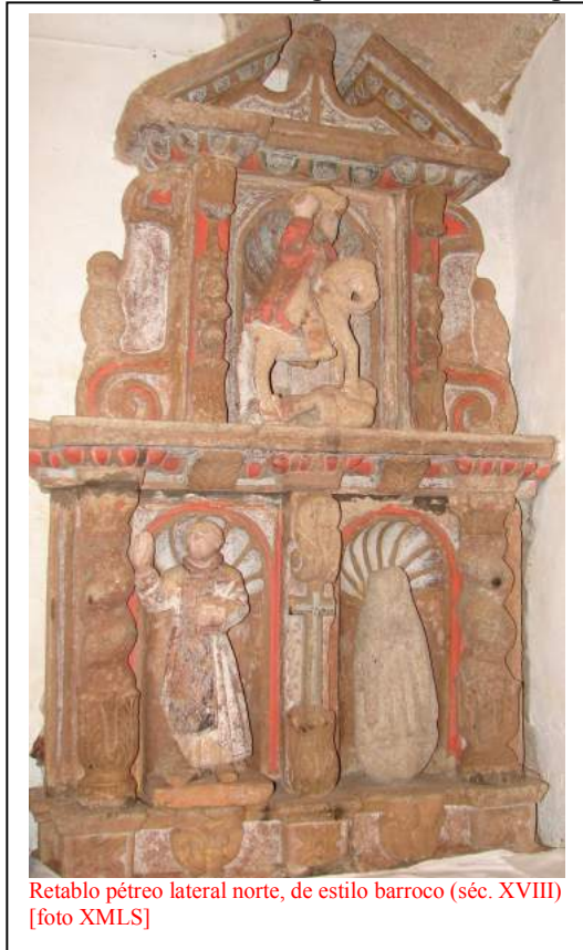
Retablo pétreo lateral norte, de estilo barroco (séc. XVIII)

Con todo, o que máis nos chama a atención do interior son dous retablos construídos en pedra, case xemelgos, situados a un e outro lado da nave no seu primeiro tramo, de traza claramente barroca: baseándonos nas columnas helicoidais ou salomónicas e noutros detalles decorativos, coidamos que tales retablos se construíron no primeiro terzo do séc. XVIII, seguramente por volta de 1717, segundo unha inscrición que aparece nun fornello sen imaxe no interior da sancristía, flanqueado por dúas voluminosas volutas. Foron sufragados por particulares, posiblemente un fidalgo local ou un labrego rico, tal como se nos fai saber na inscrición incompleta que a duras penas se aprecia na arquitrabe do retablo sur: "...COLATERALES HIZO 1 ...NTO A SU COSTA Y DEVOCION...". Como xa non se distinguen máis letras, quedamos sen saber quen fora o devoto.