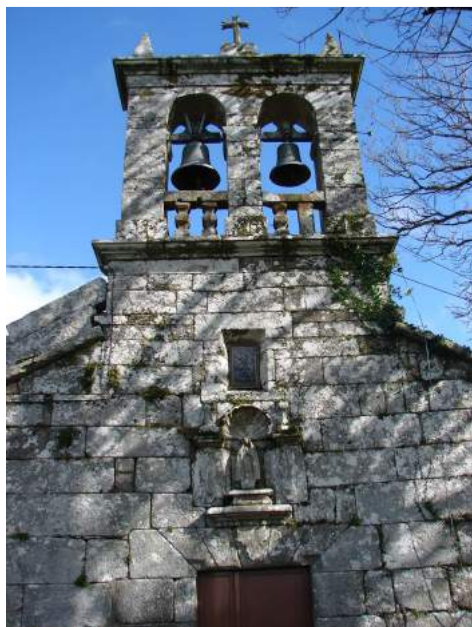
Fachada barroca da igrexa de Brandosñas (séc. XVIII)

O templo é de gran simplicidade arquitectónica. Presenta unha planta de salón cun presbiterio e unha nave rectangulares. A fábrica actual posiblemente date da segunda metade do séc. XVIII, e a parte máis interesante é a fachada, de cantería, coroada por unha espadana do séc. XIX de dous arcos de medio punto que prestan acubillo a cadansúa campá. A porta principal remata nun arco alintelado (o lintel confórmano doelas dispostas en posición radial), sobre o que vai unha fornela rematada en arco de medio punto que acubilla unha imaxe pétrea da Virxe, a patroa da freguesía, posiblemente barroca, do séc. XVIII.