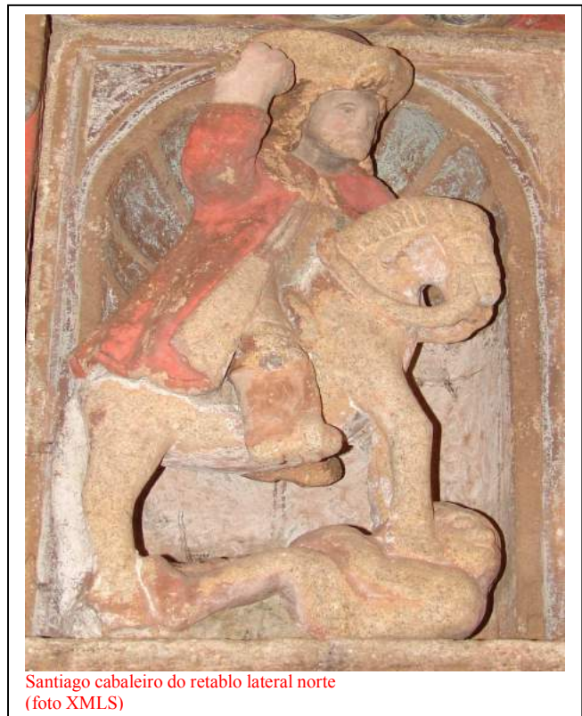
Santiago cabaleiro do retablo lateral norte

Os dous retablos van cubertos por un dosel curvo e presentan a mesma estrutura: un corpo principal flanqueado por columnas salomónicas dividido en dous paneis e un ático entre volutas enmarcadoras rematado nun frontón triangular partido. Estiveron pintados e aínda conservan restos de pintura, e tamén as imaxes.