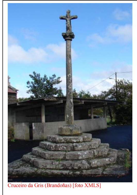
Cruceiro da Gris (Brandoñas)

A figura do lado leste parece ser unha Inmaculada; só damos visto as formas dun manto que debe cubrir o