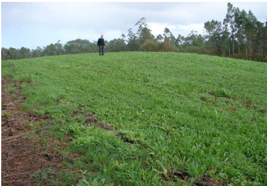
O tamaño da mámoa dos Currais, tomando a figura humana como referencia